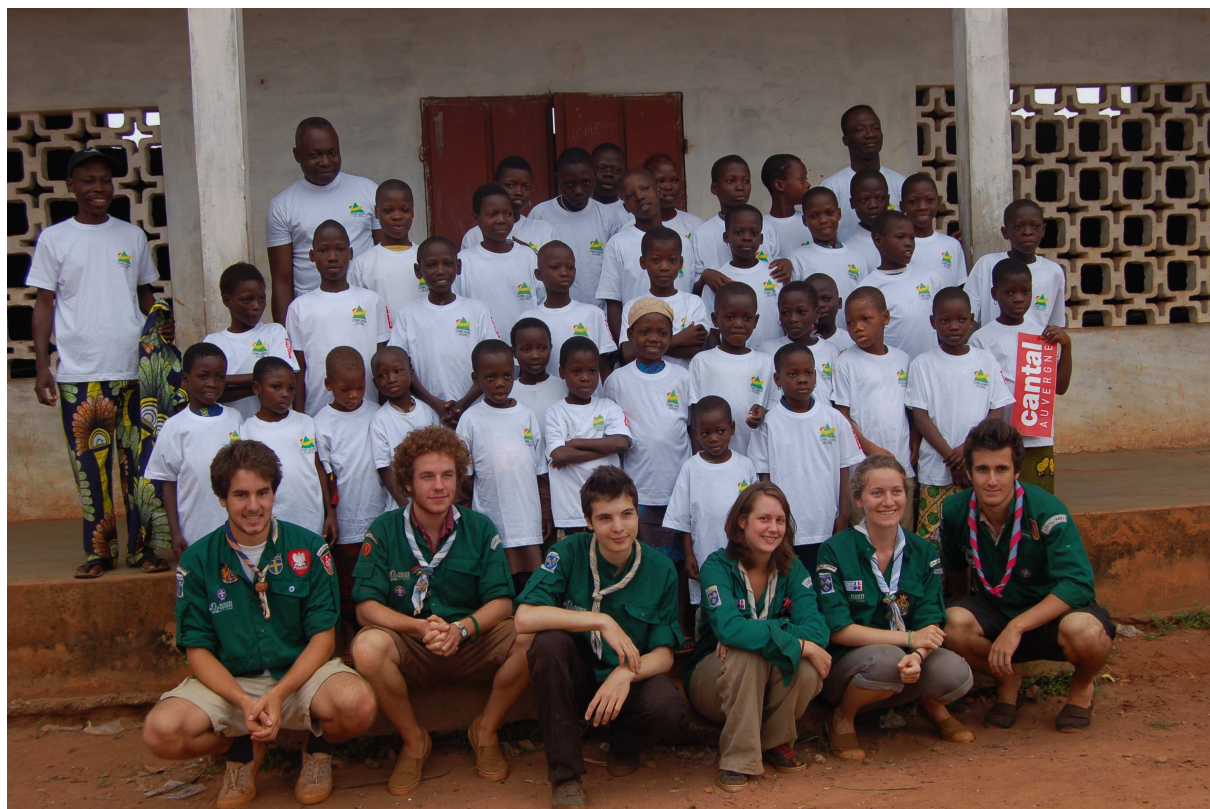
Les 6 scouts avec les élèves de l'école d'Atchomé.

bonne humeur en compagnie de 3 ouvriers béninois. A leur départ, les murs de la pailotte étaient en voie de finition. Ils ont également tenu à participer financièrement à l'achat de matériaux, ciments et fer (200 €). La compétence de ces jeunes gens ne s'arrêtaient pas qu'aux travaux manuels : l'après midi, ils encadraient des jeunes élèves de l'école d'Atchomé (petit village dépendant de Saclo) dans le cadre de soutien scolaire auprès de jeunes enfants de CE1, CM1 et CM2 (voir photo ci-dessous). Les 6 jeunes gens ont mis tout leur cœur dans ces différentes activités et la population béninoise a été très sensible à leurs qualités.